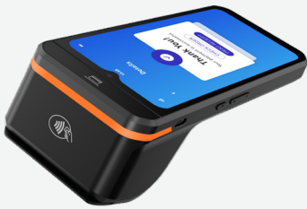
6,5" Smart Payment Device