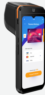
Android 14 GMS, NFC-Softpayment